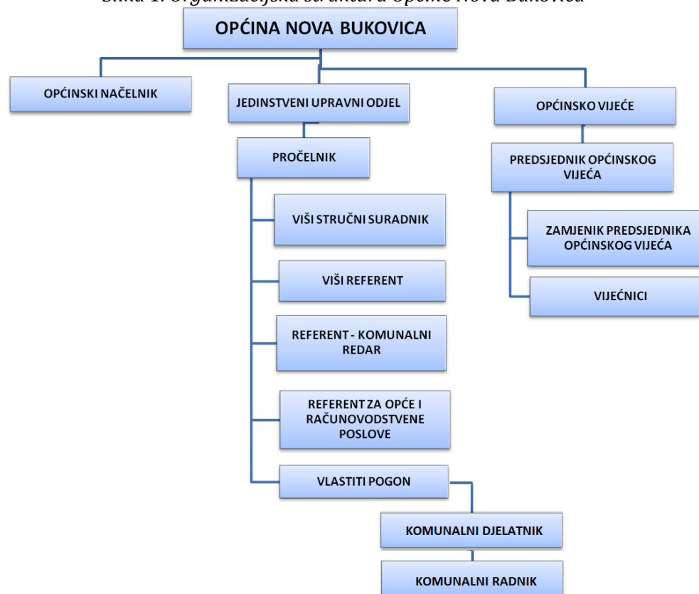
Slika 1. Organizacijska struktura Općine Nova Bukovica

Izvor: Web stranica Općine; https://novabukovica.hr/#