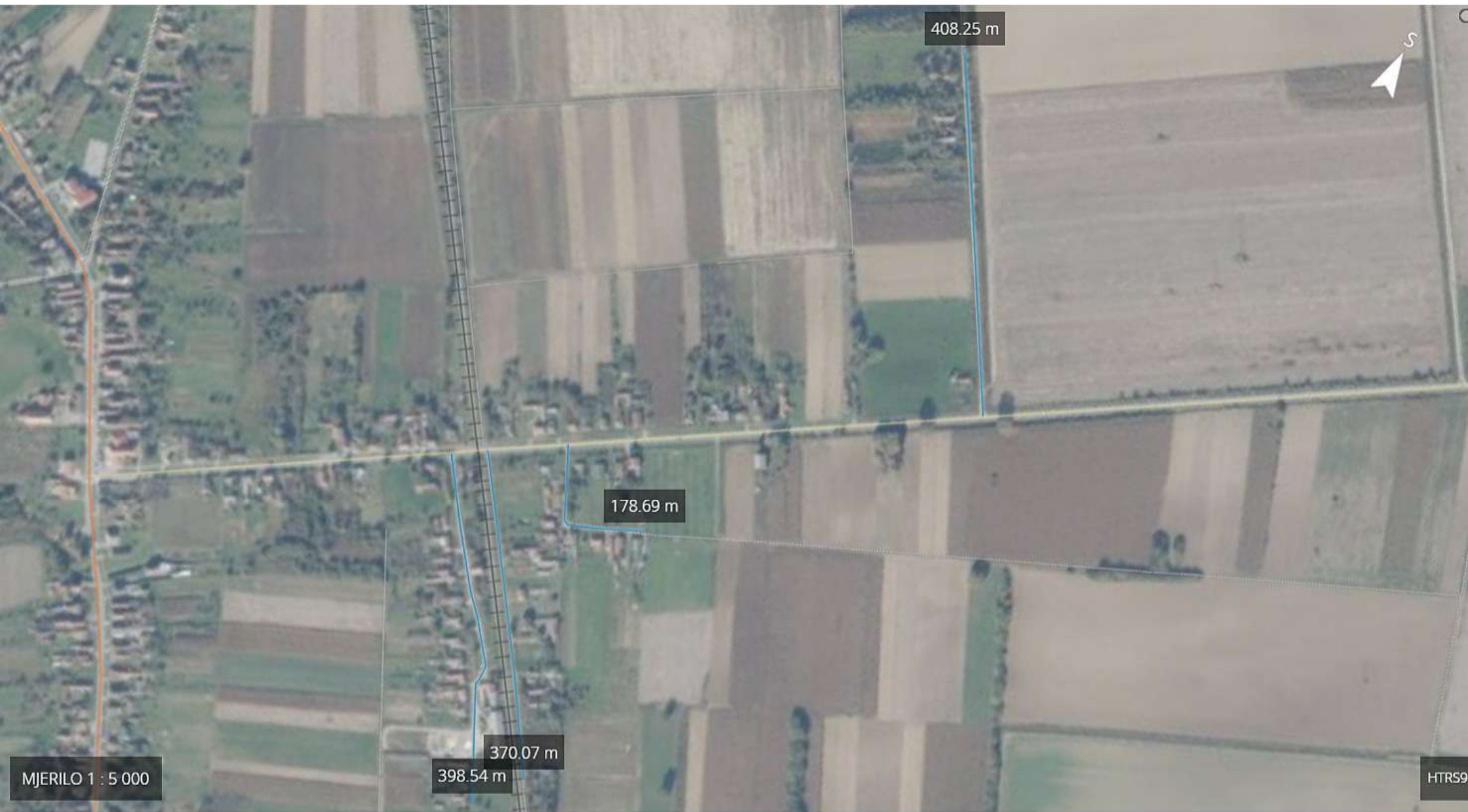
Mikićeva, Ivoševa, Maračićev i Topolak