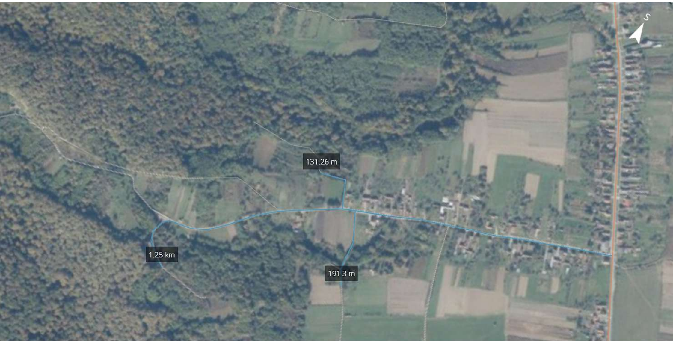
Ulica Zrinskih i Frankopana